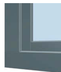
Moderne Optik mit stumpf gestoßener Aluminium-Vorsatzschale